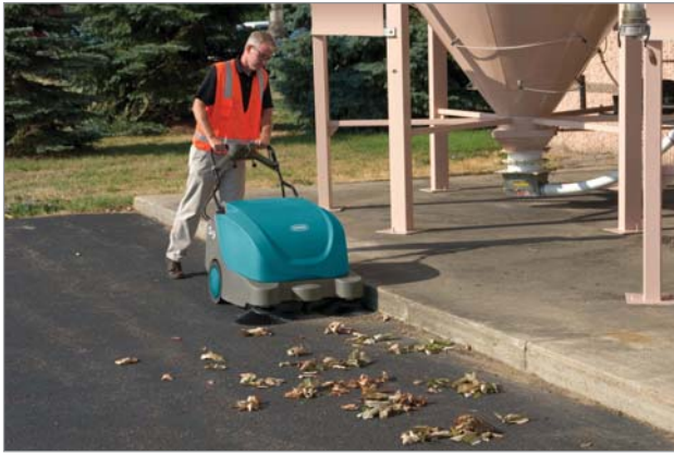
施設の外周、倉庫内、ハードフロアの清掃などに