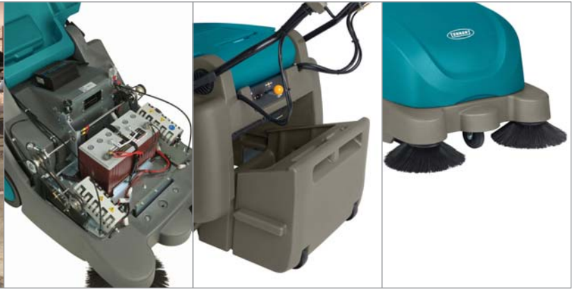
メンテナンスフリーバッテリー、内蔵充電器、車輪付60Lの大容量ホッパー、両サイドブラシを標準装備