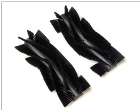
ツインメインブラシを装備