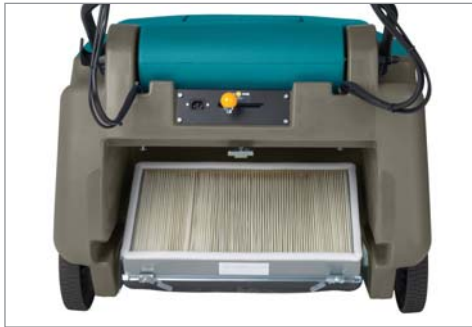
歩行型ながら大型フィルターを採用