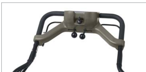
操作パネルはシンプル ハンドルは高さ調整式なので使う方の体格に合わせて調整が可能です