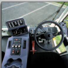
Alle veegfuncties binnen handbereik