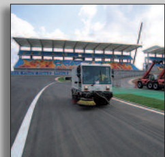
Machine in actie