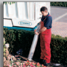
Zuigarm voor moeilijk te bereiken plaatsen