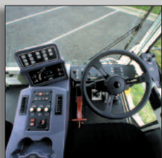
Fonctions de balayage à portée de main