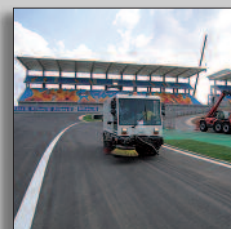
Machine en action