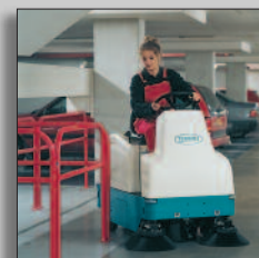
Macchina in azione