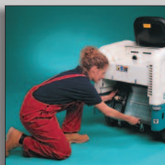
Sostituzione del filtro senza attrezzi