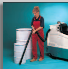
Tubo di aspirazione