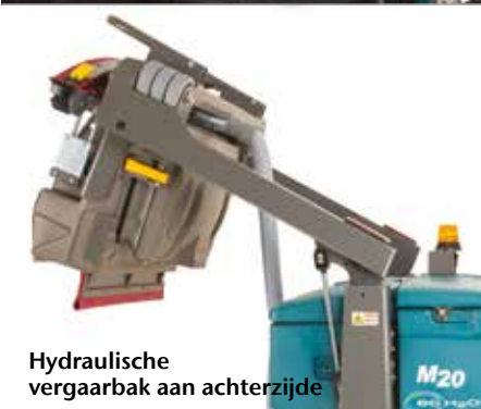
Hydraulische vergaarbak aan achterzijde

▶ Dura-Track™ parabolisch dweilframe met SmartRelease™ levert uitzonderlijke wateropname en vermindert onderhoud en vervanging van onderdelen wegens schade aan het dweilframe.