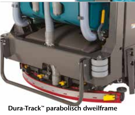
Dura-Track™ parabolisch dweilframe

Beschermkap beschermt gebruikers tegen vallende voorwerpen.