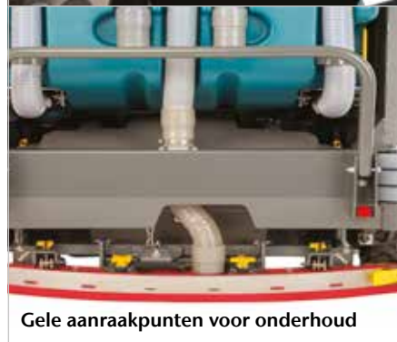
Gele aanraakpunten voor onderhoud

▶ Gele, gemakkelijk te herkennen aanraakpunten voor onderhoud besparen tijd en geld op routineonderhoud.