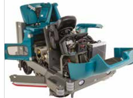
Das Design für einen einfachen Zugriff

▶ Ein großer hydraulischer Kehrgutbehälter mit stufenloser Hochentleerung (110 l | 177 kg) erhöht die Reinigungsleistung, da das Kehrgut nicht mehr manuell entleert werden muss.