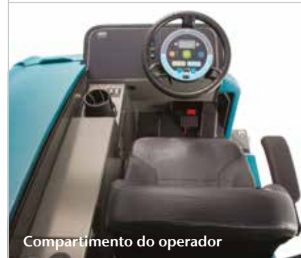
Compartimento do operador