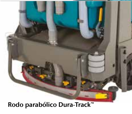
Rodo parabólico Dura-Track™