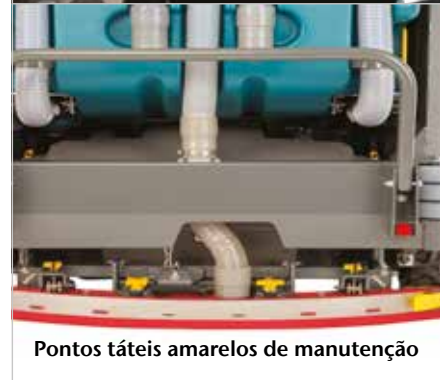
Pontos táteis amarelos de manutenção

A proteção superior protege os operadores contra a queda de objetos.