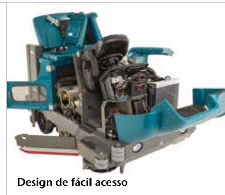
Design de fácil acesso