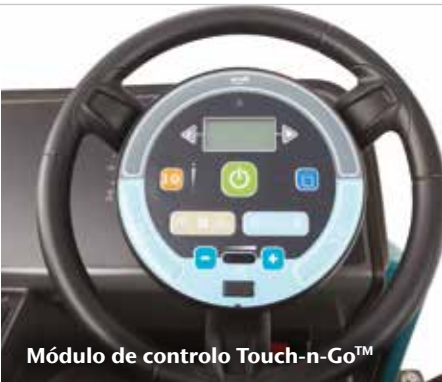
Módulo de controlo Touch-n-Go™