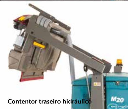
Contentor traseiro hidráulico