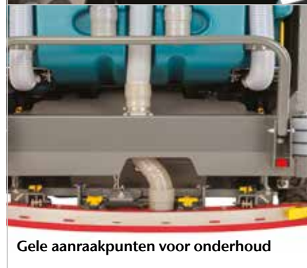
Gele aanraakpunten voor onderhoud

Beschermkap beschermt gebruikers tegen vallende voorwerpen.