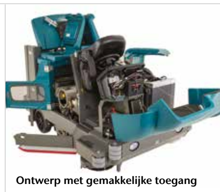
Ontwerp met gemakkelijke toegang

▶ Grote hydraulische vuilvergaarbak aan achterzijde met verschillende niveaus (110 L | 177 kg) verhoogt de reinigingsproductiviteit door het elimineren van de noodzaak om vuil handmatig te verwerken.