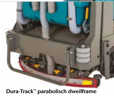
Dura-Track™ parabolisch dweilframe

▶ Gele, gemakkelijk te herkennen aanraakpunten voor onderhoud besparen tijd en geld op routineonderhoud.