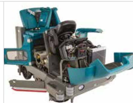
Das Design für einen einfachen Zugriff

▶ Ein großer hydraulischer Kehrgutbehälter mit stufenloser Hochentleerung (110 l | 177 kg) erhöht die Reinigungsleistung, da das Kehrgut nicht mehr manuell entleert werden muss.