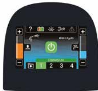
Pro-Panel® LCD-Touchscreen (Option)