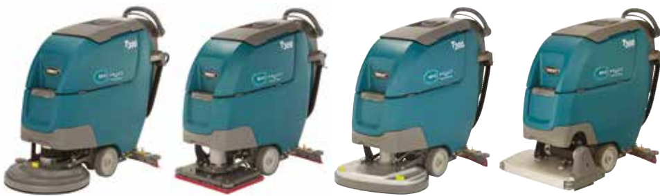
Monoteller: 430 mm & 500 mm

Die T300 Scheuersaugmaschine gibt es mit unterschiedlichen Typen von Schrubbköpfen, die auf Ihre Reinigungsanforderungen zugeschnitten sind und die Reinigungsleistung optimieren.